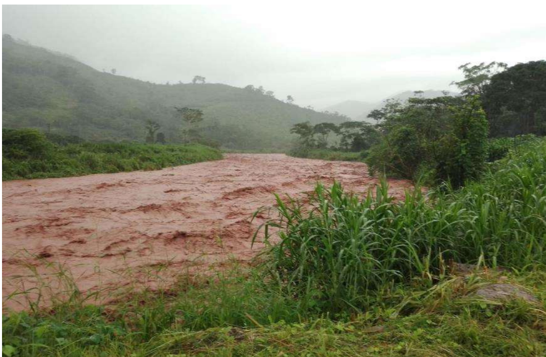
En la columna de fotografías se observa: el RIO MAZAMARI (RIO PANGO), en sus máximas avenidas.