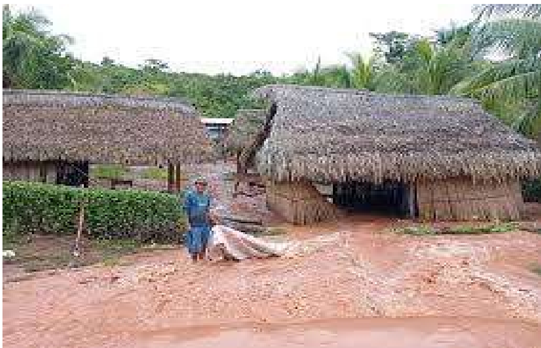
En la columna de fotografías se observa: el desborde del RIO MAZAMARI (RIO PANGO), afectando a la población San Isidro Sol de Oro.